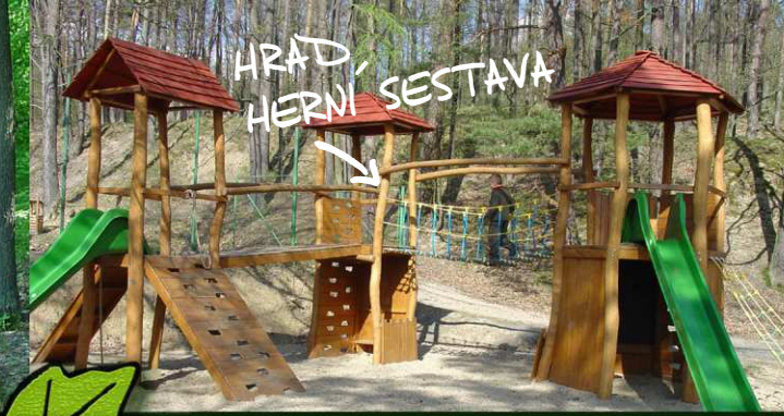
HRAD, HERNÍ SESTAVA